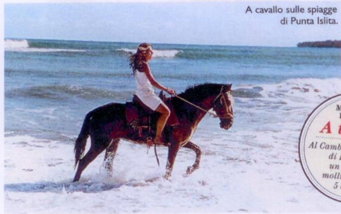
A cavallo sulle spiagge di Punta Islita.